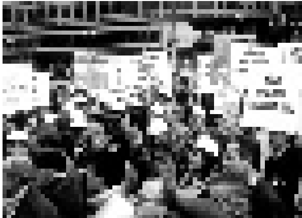
28 Kasım 2000- Kızılay YKM Önü

Halkımızın refahı ve geleceği, ülkemizin kalkınması için üretiyoruz. Ancak bu yoksulluk ücretiyle artık ne tasarımın ne denetlemenin ne de uygulamanın gereği gibi yapılamayacağı açıktır. Bu koşullar, kamuda, mühendislik ve mimarlık alanında, işgücü verimliliğini düşürmekte, hizmetlerin niteliğini olumsuz olarak etkilemekte ve bu alanda kalıcı hasarlar yaratmaktadır. Mühendisini ve mimarını bu koşullarda yaşamaya mahkum eden bir ülkede gelişme ve kalkınma çabalarından söz edilmesinin hiç bir inandırıcılığı kalmamıştır. Büyük sorumluluklar olarak çalışan mühendis ve