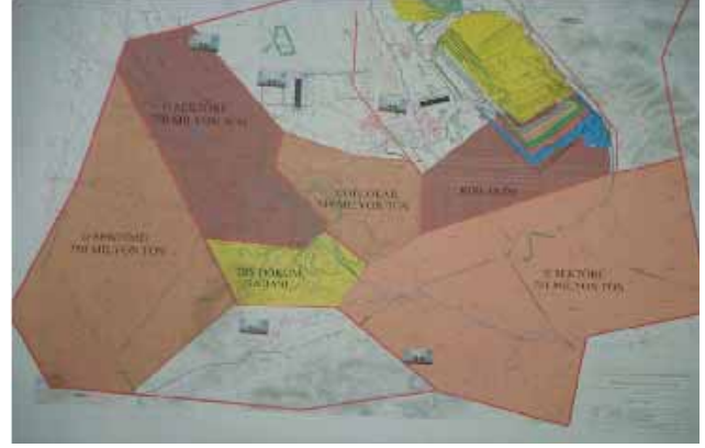
Afşin – Elbistan Linyit Havzası

Linyit havzası jeolojik olarak Toros dağlarının yükselmesi sırasında oluşmuş kapalı bir basendir. Havza temelini permokarbonifer ve üst kretase yaşlı kireçtaşları oluşturmuştur. Özellikle havzanın kuzeydoğu ve doğusunda yer alan üst kretase yaşlı kireçtaşlarından oluşmuş Kızılbaş, karstik bir yapıda olup boşluklarında çok miktarda su içermektedir. Linyit kömürü plio-pleistosen yaşlı gölsel çökeltiler arasında yer alır.