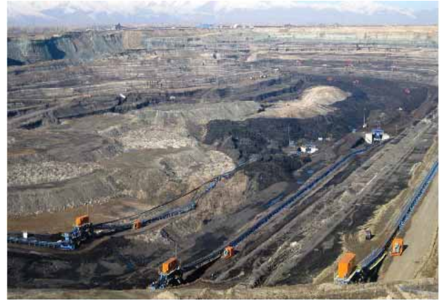
06.02.2011 Heyelanı (Fotoğraf 2)

06.02.2011 tarihinde saat 03.00 sularında meydana gelen heyelan sonucunda işletmenin güneybatı bölümünden yaklaşık 20-25 milyon m 3 malzeme ocak içine kayarak, ocak içine giden tüm yolları ve kömür naklini sağlayacak konveyör bandı kullanılamaz duruma getirmiştir. (Fotoğraf 2) Bu heyelan sırasında bir işçi hayatını kaybetmiştir.