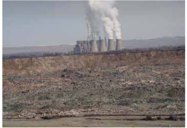
10.02.2011 Heyelanı ve A Termik Santrali (Fotoğraf 3)

10.02.2011 tarihinde sabah 10.00 sularında meydana gelen ikinci heyelan, işletmenin kuzeydoğu bölümünde yaklaşık 1000 m genişliğinde, şev başından itibaren 600 m geriye doğru yaklaşık 50 milyon m 3 malzemenin ocak içini tamamen doldurması ile sonuçlanmıştır. (Fotoğraf 3). Heyelanın ani ve çok hızlı gelişmesi sonucu şev üstünde çalışma yapan iki mühendis ve 8 işçi uzaklaşmaya fırsat bulamadan kayan malzeme içinde kalmıştır.