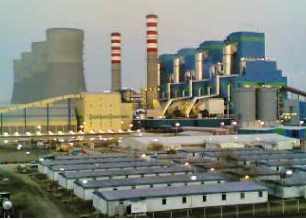
Afşin – Elbistan B Termik Santrali (Fotoğraf 1)

EÜAŞ; 1995 yılından itibaren bir taraftan Kışlaköy sektöründe linyit üretimini yaparak A santralinde elektrik üretimini sürdürürken diğer taraftan havzanın Çöllolar bölümündeki linyitle beslenecek B termik santralının inşası için 1996 yılında ihaleye çıkmıştır. İhale sonucunda 1440 MW gücündeki 4 üniteli santral inşaatı 2004 yılında tamamlanmıştır. (Fotoğraf 1) Santral inşasının tamamlanmasına karşın, linyit üretim ihalesi zamanında yapılamadığı için santralin kömür gereksinimi 2007 yılına kadar A termik santrale kömür veren Kışlaköy işletmesinden karşılanmıştır. B santrale kömür sağlayacak Çöllolar sahası, 2007 yılında ihale ile Park Teknik Elektrik Madencilik Turizm San. ve Tic. A.Ş.'ye verilmiştir.