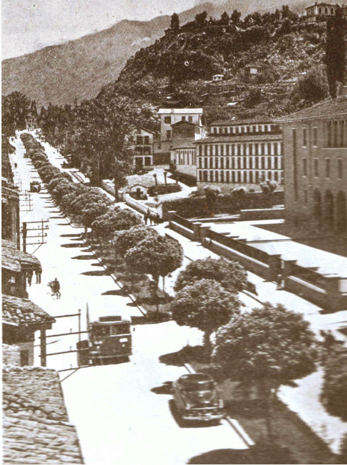
1900 'lü Yılların Başı Altıparmak Caddesi, Bursa